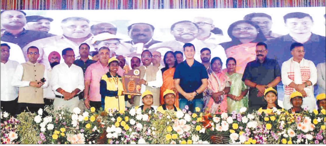
विजेता खिलाड़ियों को सम्मानित करते अतिथि।

उन्होंने कहा कि मैं भी ट्राइबल हूँ और सिक्रिम के छोटे से गाँव का हूँ। वहाँ से निकलकर मुझे भारत के लिए खेलने का मौका मिला है। यह महत्व नहीं रखता